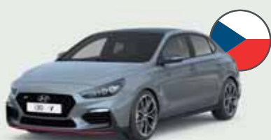
i30 fastback N