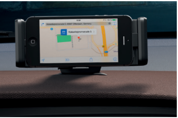
Dokovací stanice v horní části přístrojové desky. Nabízí bezpečné uchycení a nabíjení Vašeho chytrého telefonu.