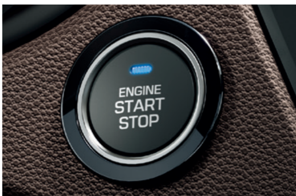
Startovací tlačítko. Bezklíčkové spuštění motoru, je-li chytrý klíček uvnitř vozu, ve Vaší kapse nebo třeba kabelce.

Pečlivě vybrané materiály vytvářejí v interiéru atmosféru vysoké kvality, která je v této třídě jedinečná. A v nabízené výbavě naleznete systémy a funkce, které překonávají očekávání v tomto segmentu. Mezi tyto výjimečné prvky patří i dokovací stanice pro chytré telefony v horní části přístrojové desky. Na dokonalém místě pro využívání satelitní navigace nebo přehrávání oblíbených skladeb prostřednictvím audiosystému. Tento systém také může udržovat chytrý telefon v nabitém stavu.