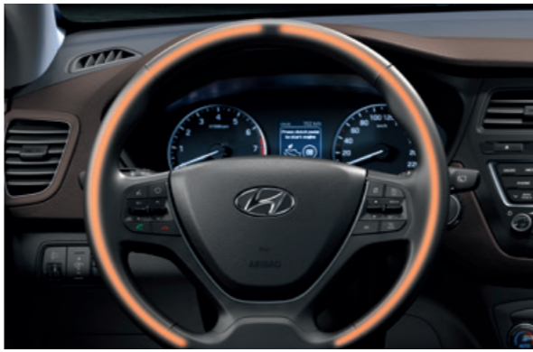
Vyhřívaný volant. Potěší Vás při odjezdu v mrazivém zimním ránu. Připojení prostřednictvím Bluetooth. Ovládací prvky na volantu pro bezpečné a snadné ovládání telefonu. S funkcí Bluetooth audio streaming budete mít také přístup ke své oblíbené hudbě.