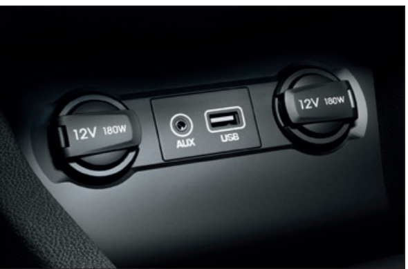
Vstupy AUX-In a USB. Snadné připojení pro chytrý telefon nebo přehrávač MP3. Přístroj připojte a můžete jej používat.