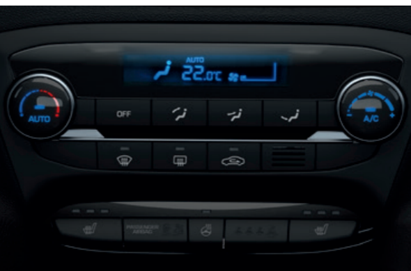
Automatická klimatizace. Nastavte si požadovanou teplotu a systém se postará o vše ostatní. K dispozici je dokonce i funkce automatického odmíznutí, která udržuje okna dobře průhledná.