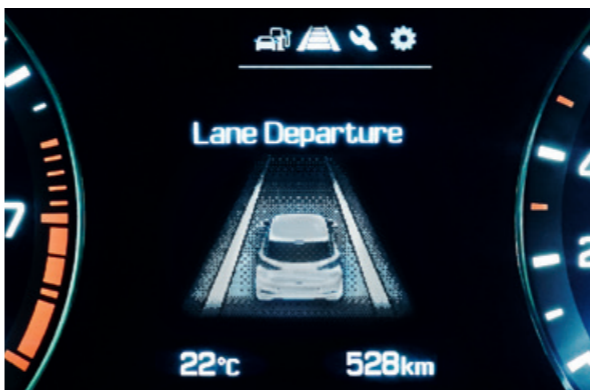
Asistent pro jízdu v jízdním pruhu. Okamžitě vizuální a akustické upozornění na nechtěné opuštění jízdního pruhu.