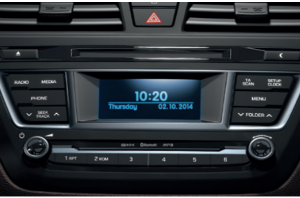
Audiosystém. Rádio RDS s přehrávačem CD/MP3. Systém lze ovládat také tlačítky na volantu.