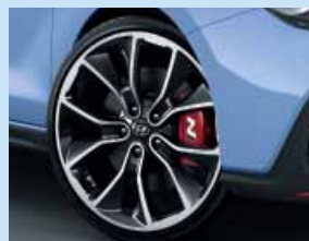
19" kola z lehkých slitin

Apple CarPlay™ je registrovanou ochrannou známkou společnosti Apple Inc. Android Auto™ je registrovanou ochrannou známkou společnosti Google Inc.