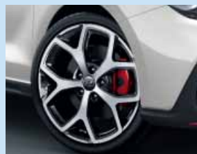
18" kola z lehkých slitin