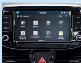
Apple CarPlay™ a Android Auto™