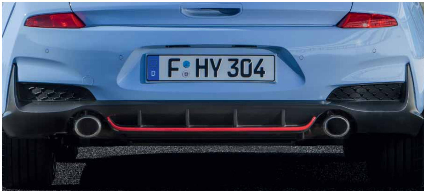
Dvě koncovky sportovní výfukové soustavy umocňují přitažlivý vzhled modelu i30 N.

Funkce Launch Control maximálně usnadňuje rozjezd vozu z klidu regulací točivého momentu motoru. Funkce vyrovnávání otáček automaticky zvyšuje otáčky motoru při řazení z vyššího převodového stupně na nižší. Výsledkem je ještě hladší a sportovnější řazení. Speciální funkce palubního počítače sleduje Vaše řídicí výkony a umožní Vám zobrazovat provozní údaje na velkém multifunkčním centrálním displeji.