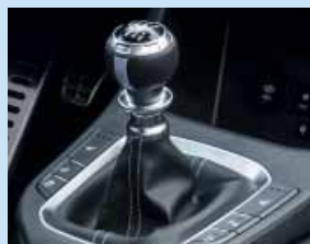
Unikátní sportovní hlavice řadicí páky