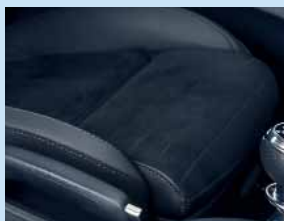
Sedák s nastavitelnou délkou