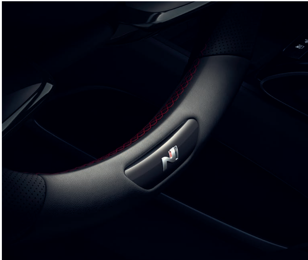
Sportovní volant s metalickými rameny je potažený jemnou kůží s červeným kontrastním prošíváním a doplněný logem N.

Vítejte na úplně nové úrovni preciznosti. Posadte se do přepracovaného interiéru modelu Tucson N Line a ihned pociťte jeho příjemnou atmosféru elegance a profesionality. Sportovní sedadla s logem N jsou potažena luxusní kombinací perforovaného semiše a kůže a vkusně doplněna červeným kontrastním prošíváním, které se opakuje i na obložení dveří a opěrce rukou. Další designové prvky N se vyskytují i na kožené hlavici řadicí páky, případně konzole s elektronickým ovládáním převodovky tlačítky „Shift by Wire“. Dalšími jedinečnými prvky interiéru Tucsonu N Line jsou černé čalounění stropu, kovové pedály, opěrka levé nohy a dekorativní lišty prahů dveří.