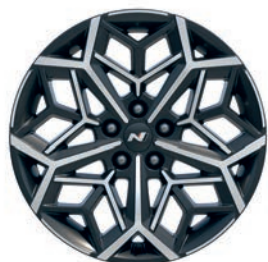
19" kola z lehké slitiny

Tucson N Line je vybavený výraznými 19" disky kol z lehké slitiny s jedinečným designem, které působí velmi energicky a sportovně.