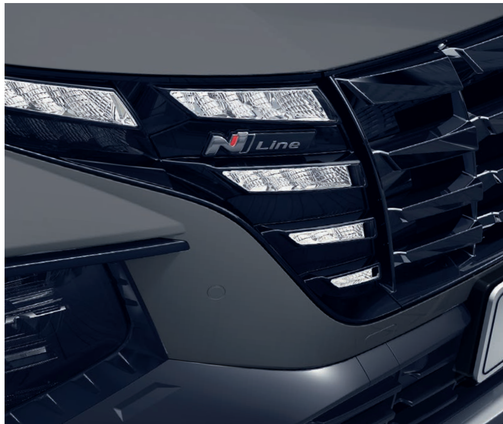
Logo N Line na jedinečné masce chladiče podtrhuje sportovní vzhled vozu.