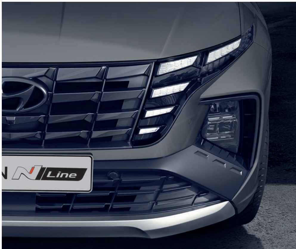
Šířší hranatý nárazník N Line se zvětšenými otvory pro vstup vzduchu je nápadným prvkem přední části karosérie.

Konstruktéři zvýraznili stabilní široký postoj modelu Tucson N Line posunutím masky chladiče a nárazníků více do boků, což zdůrazňuje horizontálně orientovaný, atletický vzhled vozu. Šířší lichoběžníková maska chladiče nese logo N Line a přední světlomety jsou černě lemovány, aby ještě více vynikla jedinečnost designu N Line.