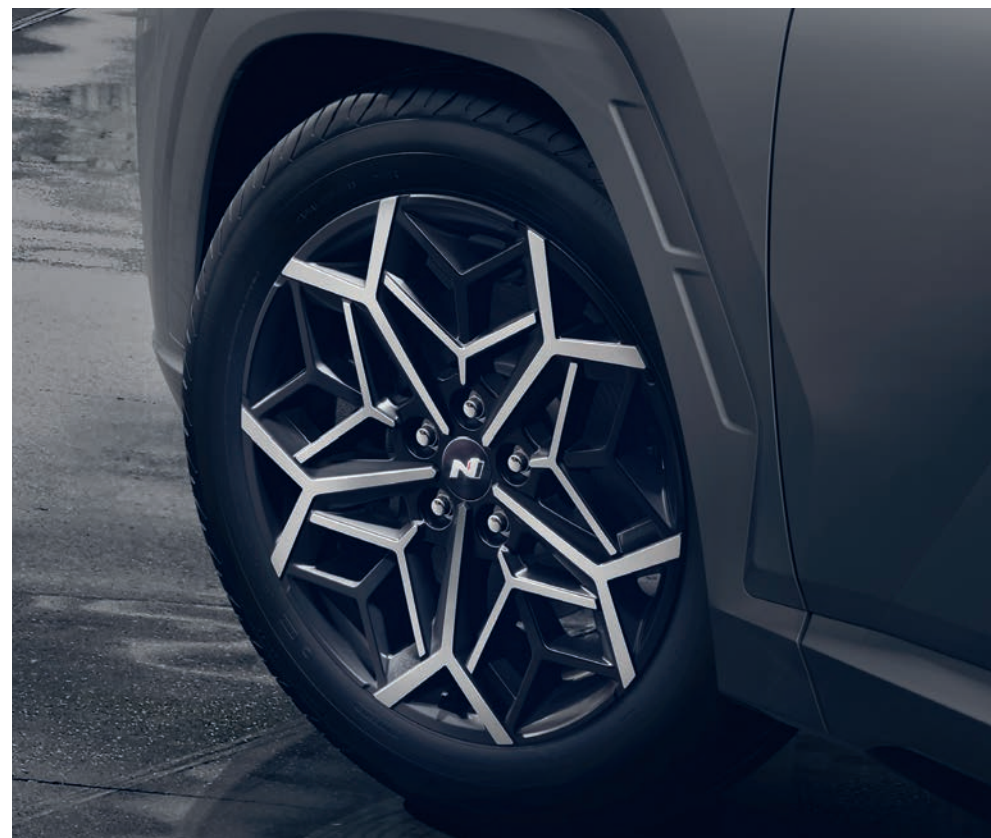
Výrazné 19" disky kol z lehké slitiny umocňují sportovní vzhled modelu Tucson N Line.