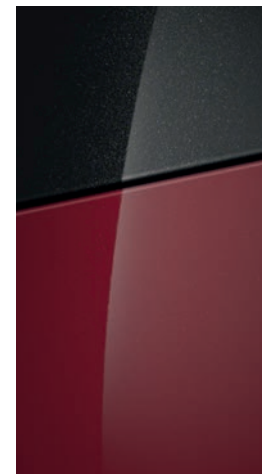
Sunset Red Pearl

Na přání střecha v barvě Phantom Black Pearl.