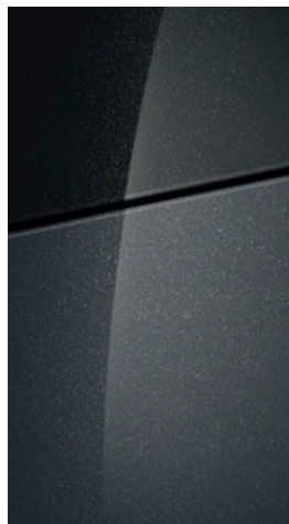
Dark Knight Gray Pearl

Na přání střecha v barvě Phantom Black Pearl.