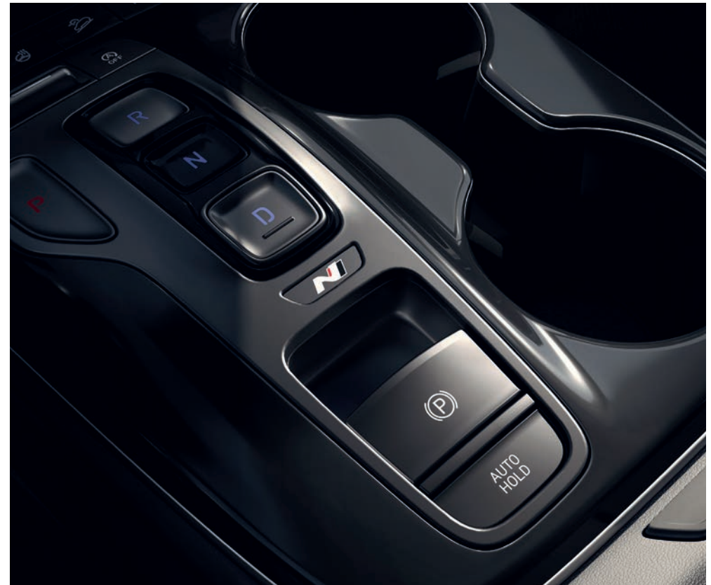
Logo N je umístěno i na elegantním krytu středové konzoly s elektronickým ovládáním převodovky tlačítky „Shift by Wire“.