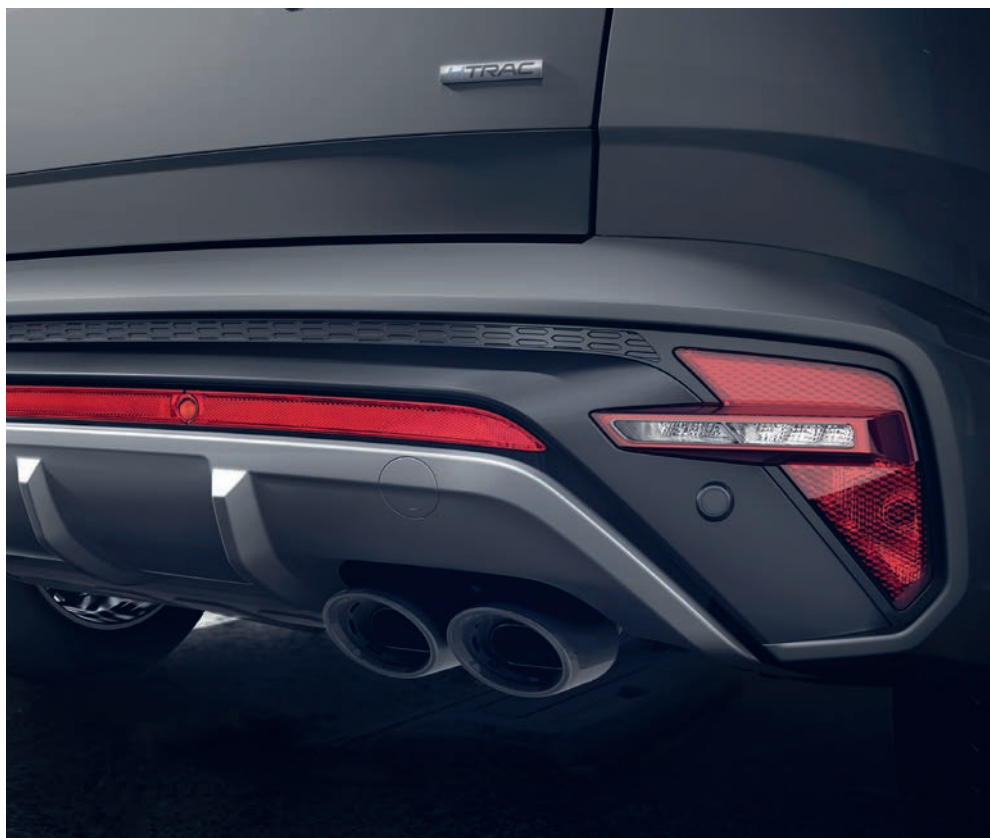
Zadní nárazník se sportovní dvojitou koncovkou výfuku je harmonicky doplněn stříbrným difuzorem, který je akcentovaný červeným reflexním pásem.